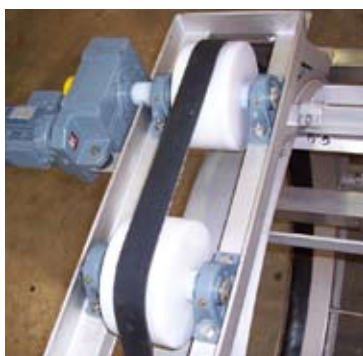
Entraînement du tambour par une courroie.