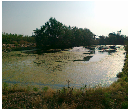
Situation après 5 jours de traitement