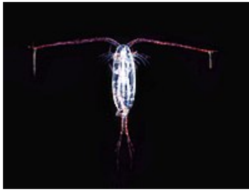
Image de zooplancton

Le zooplancton, vivant en profondeur des eaux, se nourrit essentiellement de phytoplancton (ensemble des organismes végétaux vivant en suspension dans l'eau, comme les algues unicellulaires). Ainsi, sa quantité et sa composition ont un impact majeur sur toute la chaîne alimentaire et joue un rôle essentiel dans le fonctionnement de l'écosystème car si le zooplancton est présent en quantité, il va permettre de contrôler la prolifération des algues si le milieu aquatique lui est favorable.